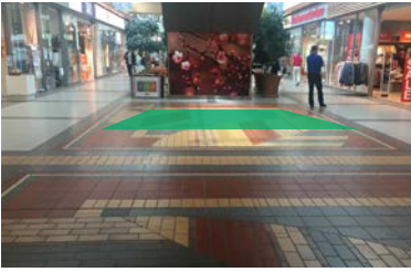
Paikka 3b • Intersport 3 x 3 m - sähköt tilataan