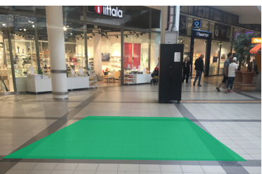
Paikka 12 • Iittala 3,5 x 3,5 m - sähköt tilattava