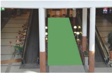
Paikka 6 • Myllyntorin sisään- käynti 3 x 15 m - sähköt tilataan