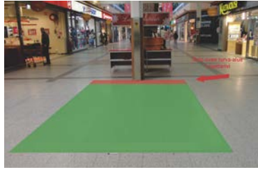
Paikka 2 • Myllyn Apteekki 3 x 4 m - sähköt tilataan