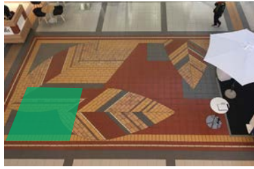
Paikka 4 • Sokos 2 x 2 m - ei korkeita elementtejä, kuten seinäkkeitä tai roll uppeja - sähköt tilataan