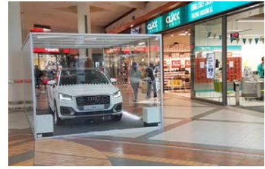
Paikka 8 • Nissen 3 x 5 m - sähköt tilataan