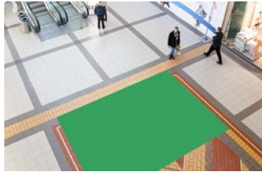
Paikka 7 • Hemtex 3 x 3 m - mainosmateriaalien max. kork. 1,7 m - ei sähkömahdollisuutta