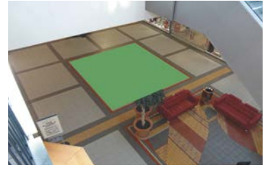
Paikka 3a • Intersport 6 x 5 m - sähköt tilataan