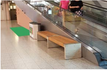
Paikka 1 • Liukuportaiden edusta, Leonidas 2 x 1 m - pistorasia alueella