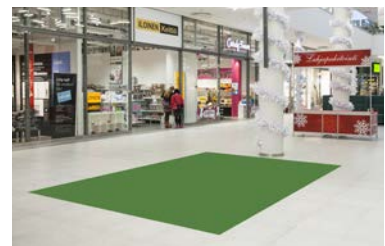
Paikka 11 • Clas Ohlson 3 x 4 m - pistorasia alueella