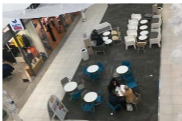
Paikka 10 • Myllyn Olohuone max 5 x 14 m mattoalue - pistorasia alueella