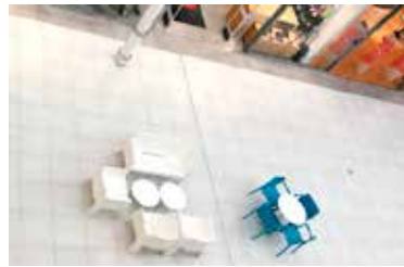
Paikka 10 • Myllyn Olohuone