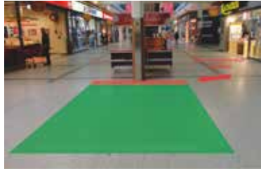
Paikka 2 • Myllyn Apteekki 3 x 4 m