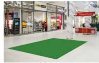
Paikka 11 • Clas Ohlson 3 x 4 m