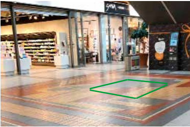
Paikka 3b • Esprit 3 x 3 m