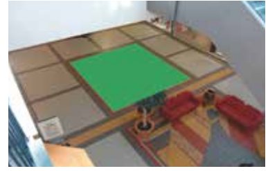
Paikka 3a • Intersport 6 x 5 m