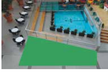
Paikka 5 • Myllyntori 6,7 x 1,8 m