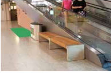
Paikka 1 • Liukuportaiden edusta, Leonidas 2 x 1 m