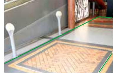
Paikka 6 • Myllyntorin sisään- käynti 3 x 15 m