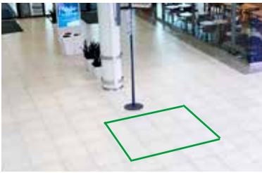
Paikka 9 • Länsitori 2 x 2 m